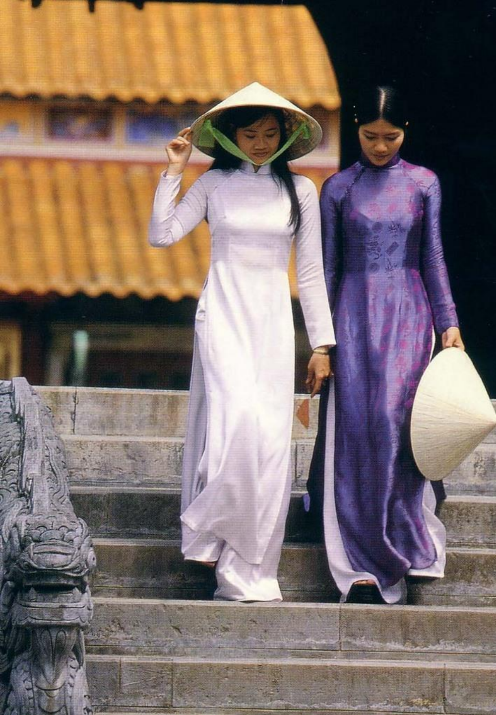
Ao Dai (アオザイ)