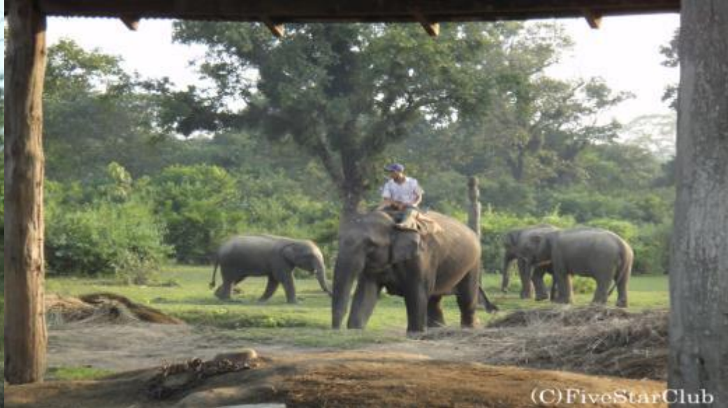
チトワン国立公園