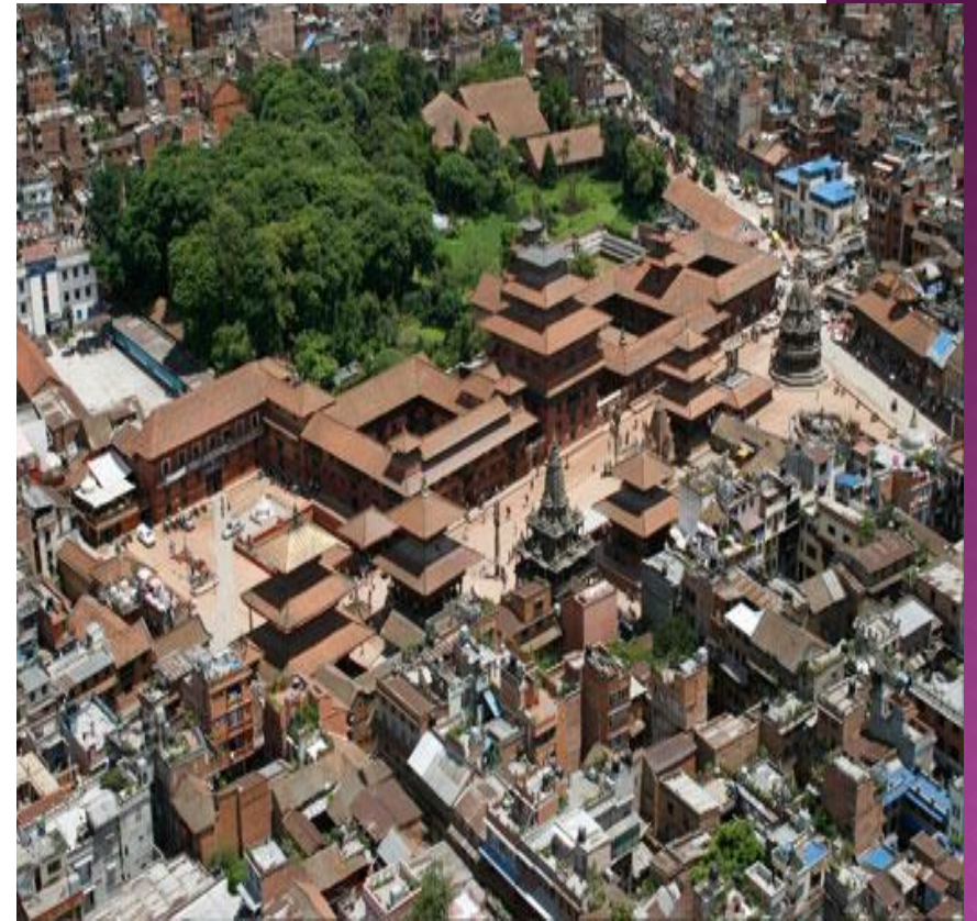
パタンダルバル広場